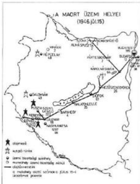
A MAORT üzemi helyei (1946. július 15.)

Magyar-Amerikai Olajipari Rt. (MAORT) termelési mérnöke, majd termelési felügyelője volt, ebben a beosztásban 1945-től 1948-ig a magyar olajtermelést irányította. Tervezte és kiépítette a két zalai olajmezőt, Budafapusztán (Bázakerettyén) és Lovásziiban az akkor még Európában sehol sem alkalmazott modern gázvisszanyomásos termelési rendszert.