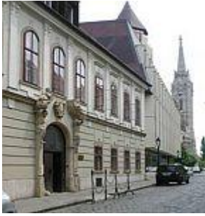
Budapest, Táncsics utca, Kulturális Örökségvédelmi Hivatal székháza

Akár szimbolikus értékkel is bír, hogy a hajdani Országos Műemlék Felügyelőség (ma Kulturális Örökségvédelmi Hivatal) székháza a budai várnegyedben a Mátyás templom szomszédságában Erdei Ferenc terve alapján készült (Havassy Pállal együtt), egy 18. századi műemléképület helyreállításával, újszerű zártudvaros bővítésével 1965-1967-ben. Az utcaképben fontos szerepet játszó késő-barokk homlokzatot hitelesen helyreállították; ám a "palotahomlokzat" mögött új belsőteret alakítottak ki.