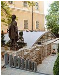
Veszprém, Szt. György kápolna