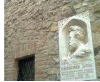
Székesfehérvár, Oskola utca 6. részletek

A fehérvári Megyeház u 11. sz. „Istenszemes ház” helyreállítása (1980-83) is Erdei Ferenc nevéhez fűződik. Az utcasorban álló klasszicizáló barokk lakóház a 18-19. század fordulójáról késő középkori eredetű falak felhasználásával épült. Később az utcai homlokzatot gótizáló stílusban átalakították, majd ezt utóbb el-takarták. Erdei Ferenc terve alapján a köztes állapotot állították helyre. Az átépítéskor keletkezett félköríves ablakokat megőrizték, körülöttük kibontották az eredeti kora klasszicista, gótizáló homlokzati architek-túrát, a kapu két oldalán, szimmetrikus elrendezésben pillérekre támaszkodó csúcsíveket. Szép kapujának kovácsoltvas részletei figyelemre méltóak. A népi elemekkel díszített homlokzat a 1960-as években tatarozás áldozata lett, de visszaállították a homlokzaton a ka-pu fölötti félköríves oromzat stukkóból készült „Isten szeme” ábrázolást, amely a korábban elpusztult.