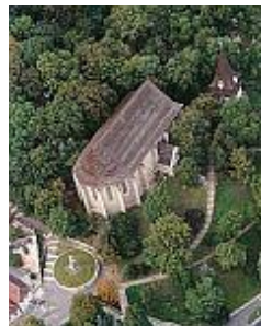
Miskolc, avasi templom