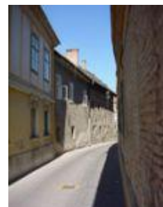
Székesfehérvár, Oskola utca 6.

A műemléki helyreállítás tervezője, Erdei Ferenc szerint, utalva egy korábbi indo-