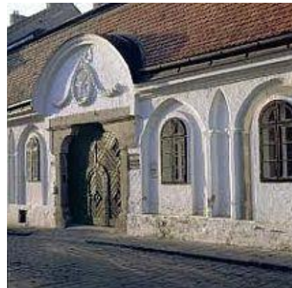
Székesfehérvár, Megyeház utca 11.

Erdi Ferenc 1967-ben Ybl-díjat kapott „a műemléki épületek helyreállításának tervezési munkájáért, különös tekintettel a veszprémi Szt. György kápolna védő-épületének és a szigetvári vár helyreállítási terveire”.