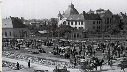
Jézus Szíve templom, mögötte Aggok Háza és árvaház