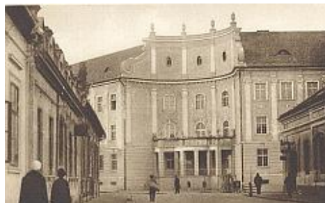
Polgári leányiskola (zárdaiskola) 1929.