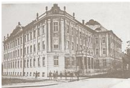
Polgári fiúiskola 1932.

Számos egyházi megrendelése között szerepel a székesfehérvári belvárosi polgári zárdaiskola (ma Petőfi iskola), ahol az egymáshoz tompaszögben álló épületszárnyak találkozásánál, a forgalmas utcasarok tehermentesítésére, jellegzetes térhomorulatot „hajlított” a bejáratnál, amely a felette levő attikával együtt díszes neobarokk architektúrát képez. Szemben a polgári fiú-, majd leánygimnázium markáns épülete (ma Teleki Blanka Gimnázium) követi a hegyesszögű utcavonalat.