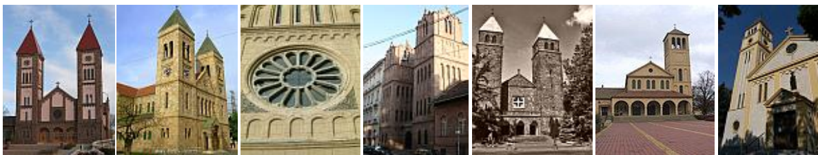
Balatonfüred 1927. Budapest 1929. Pécs 1930. Budapest 1931. B.tomaj 1932. Hmvásárhely 1937. Szentes 1943.

Életművében a történelmi formavilágot használta fel a templomainál is, sőt több olyan is épült, melyek határozott középkori formákat idéznek (Balatonfüred, Pécs, Badacsonytomaj). Fővárosi templomai (Üllői úti, egykori Haller téri, Szondy utcai) határozott neoromán formakincs felhasználásával épültek. Ugyanebben a stílusban tervezte a pécsi Szent Mór Kollégiumot (1928) is.