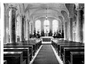
Budapest Villányi út, Szent Margit Gimnázium