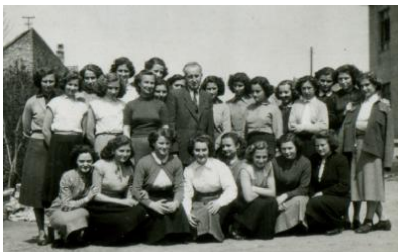
1955: diákjai körében

A Nyugat-magyarországi Egyetem Geoinformatikai Karának személyzeti anyaga. Az alkotó ember. A Sziget utcai Általános Iskola honismereti szakkörének dolgozata. 1982. Székesfehérvár