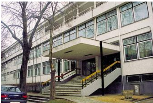
GEO - Pirosalma u. 1-3., Székesfehérvár