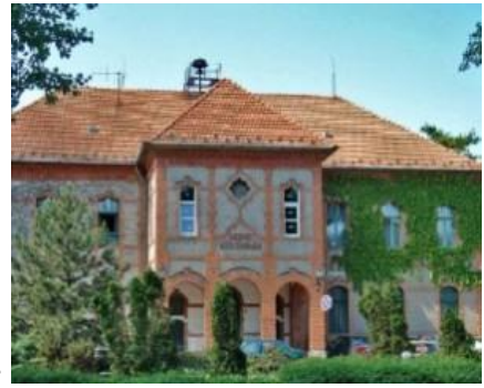
Szent György Kórház, Székesfehérvár