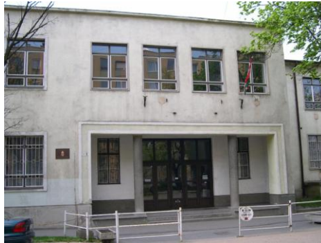
Jáky József Technikum, Székesfehérvár