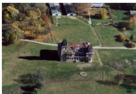
Csalai Kégl-kastély kertje

A park hátsó sarkában a kastéllyal egy időben, és ugyancsak Hauszmann tervei alapján épült, egykori istálló, kocsiszín és cselédház földszintes, belső udvar köré csoportosított épületegyüttese húzódott meg, melyeket az 1990-es években sajnálatosan elbontottak. A park másik részében egykor harangtornyos kápolna állt (mára elpusztult). A park bejáratánál, az úttal párhuzamosan, az egykori földszintes kapuórház, kertész- és virágház romjaiban ugyan, de ma is látható.