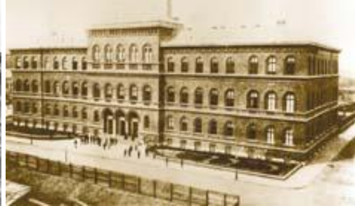
Budapest, Markó utcai főreáliskola

Ebben a korszakában épült fel tervei alapján Kégl György, székesfehérvári földbirtokos, a Fejér vármegyei kórház megalapítójának kastélya, az akkor Pákozdroz tartozó Csala-pusztán (1876-1878). A neoreneszánsz stílusú épület egy impozáns tájképi park közepén áll. Főhomlokzata nagy, lejtős facsoportokkal díszített tisztásra -pleasure groundra- tekint. Összetett alaprajzú épület, forma-világát az olasz, a német és a francia reneszánsz előképek határozták meg, a francia reneszánsz kastélyokat idéző színvilágát pedig a vöröstégla falsík és a kőtagozatok festői kontrasztja jellemzi. A főhomlokzat bal szélén manzárd tetővel koronázott torony áll.