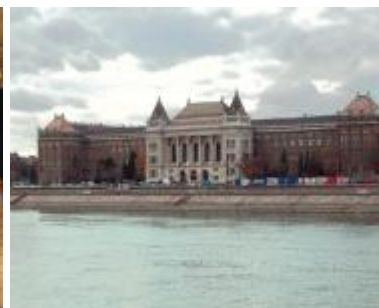
Budapest, Királyi Kúria, ma Néprajzi Múzeum