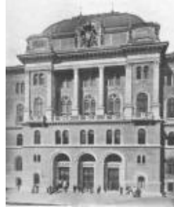
Bp. Törvénykezési palota