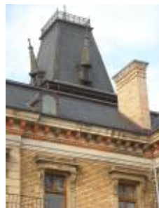
Csalai Kégl-kastély homlokzati részletei