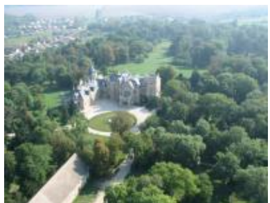
Nádasdladányi kastély www.tothgeza.hu

A Székesfehérvár közelében álló nádasdladányi kastélyt 1851-ben vásárolta meg a Nádasdy család a Schmiedegg gróftól , mai képét az 1873-76 között folytatott építkezés alakította ki. Gróf Nádasdy Ferenc megbízásából Linczbauer István tervei szerint és Hübner Nándor székesfehérvári építész kivitelezésében a XVIII. században létesített barokk kastélyhoz kétszintes új szárnyat építettek. Így alakult ki az angol gót stílusú kastély.