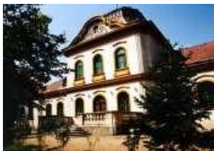
Velence, Hauszmann-Gschwindt kastély