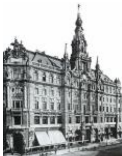
Budapest, New York palota

Ybl Miklós halála után 1891-ben őt hívták meg a magyar királyi vár építésének vezetésére, melynek nehézségét fokozta az, hogy a nagy építész előd emlékével elszakíthatatlanul egybefüggött. Befejezte az Ybl által elkezdett bővítést és kialakította dunai homlokzatát (1891–1904). Ybl várpalotájának tervéről csak vázlatos feljegyzéseket hagyott, Hauszmann azért teljesen önálló tervezésbe fogott. A Mária Terézia kori barokk palota mellé egy másik hasonlót épített, és a kettőt egy magas kupolával megkoronázott épülettel kötötte össze. Az eredeti épület arányait és a Várhegy eredeti sziluettjét is ezzel teljesen megváltoztatta, ez a mai Budapest látképének legmarkánsabb hangsúlya.