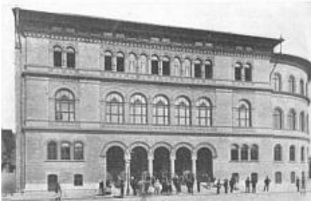
Bp. Technológiai és Iparmúzeum

Korai műveiben az olasz reneszánsz stílusában tervezte épületeit, kihasználva a nyerstégla homlokzatok művészi lehetőségeit (József Műegyetem kiegészítő épülete, 1873; István Kórház 1880–82; Erzsébet Kórház, mai Sportkórház pavilonja 1882–84; Markó utcai főreáliskola 1883–84; Technológiai és Iparmúzeum 1887–89; Törvényszéki Orvostani Intézet 1889).