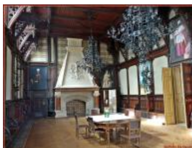
Ősök csarnoka