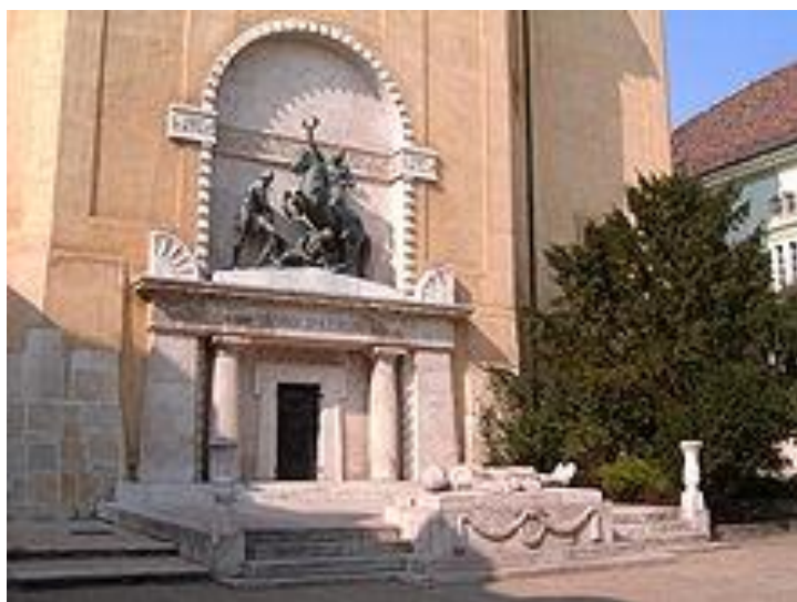
Székesfehérvár, Hősi emlékmű