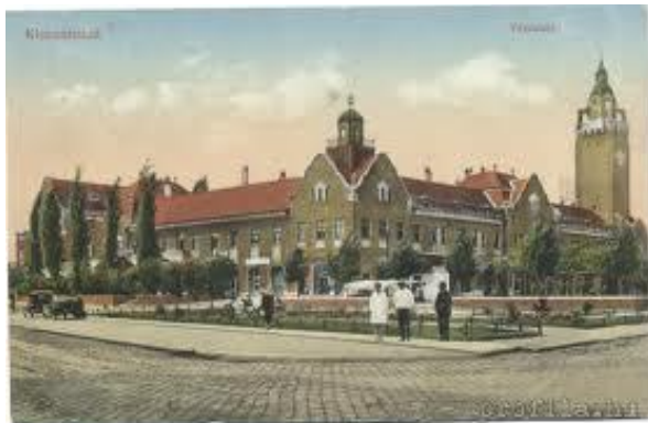
Kiskunhalas - városháza

Míg a monumentális emlékműpályázatok nem jártak sikerrel, kisebb megbízásokkal foglalkozott. Ilyen volt pl. Fernbach Károly babapusztai kastélyának megtervezése (1908), vagy első fővárosi épülete, a Szentendrei úti községi iskola terveinek elkészítése (1910).