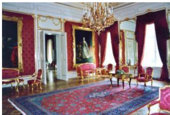
Sándor-palota a Budai Várban

Érdeemes említeni, hogy a Sándor-palota két termének az ún. Minisztertanácsi sarokteremnek és a Miniszteri várószobának az enteriőrjét Hikisch Rezső 1927-28 közötti, a klasszicizmus korábbi értékeit megbecsülő, a neobarokkos korszak helyenkénti túlzásait tompító belsőépítészeti munkája alakította át. A Hikisch-féle, puritánságra törekvő elv az 1930-as években további renoválást is hozott az épületben. Ekkor a palota eredeti, empire stílusát erősítendő, neoempire dekoráció érvényesült.