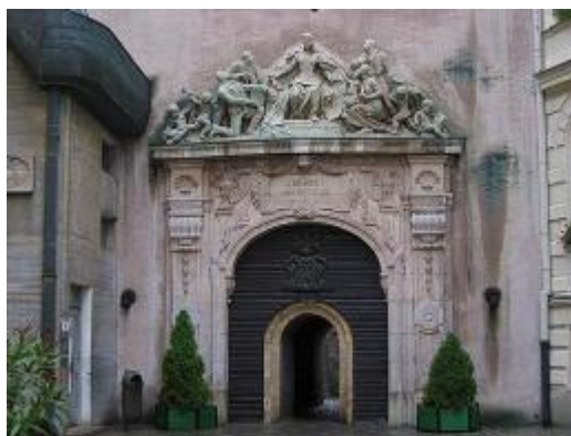
Sopron – Hűség-kapu

Kevéssel halála előtt egy nagyszabású terven dolgozott: a Rudas-fürdő átépítésén. 1934. július 28-án, rövid betegeskedés után hunyt el Budapesten. Sírja a Kerepesi temetőben található, síremlékét – a vele több közös munkán együtt dolgozó – Damkó József szobrászművész készítette. A Nyugat folyóirat is megörökítette emlékét; Farkas Zoltán írt nekrológot róla.