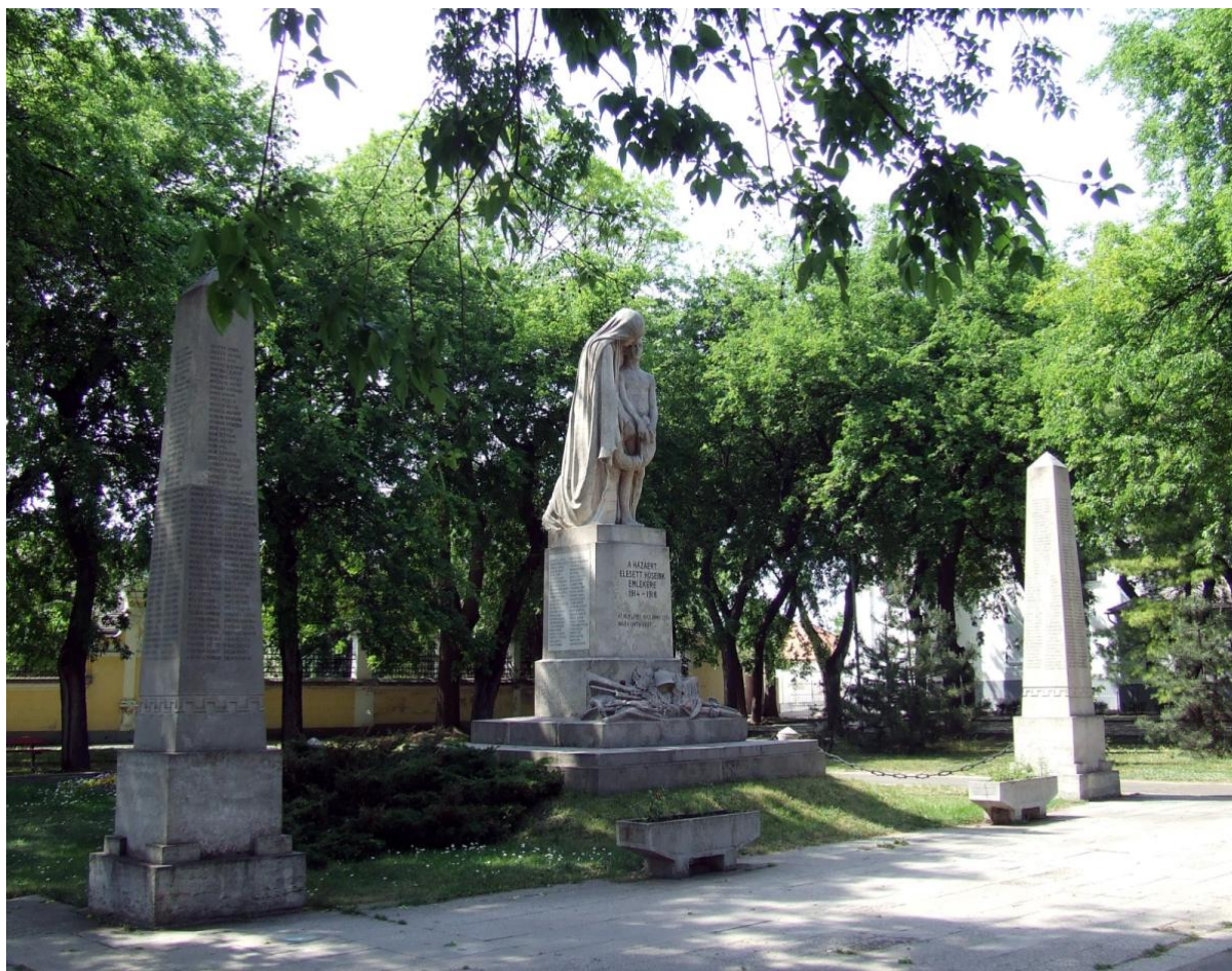
Az I. világháború hősi halottainak emlékműve (Hősök szobra) Kiskunhalason. Szentgyörgyi István szobrászművész és Hikisch Rezső építész alkotása (1926)

Hikisch munkásságára jellemző, hogy bár működése idején a magyar építészet még a különböző történelmi stílusok utánzásával próbálkozott, ő arra törekedett, hogy egyedi stílusban alkosson. Ez az ő esetében mégsem radikális szakítást jelentett a múlttal. Hikischt azok az áramlatok nyerték meg, amelyekben némi klasszicizálás volt érezhető: egyszerű, nyugodt, derűs, könnyen áttekinthető épületképeket alkotott, elődeinél egyszerűbb eszközökkel ért el hatást.