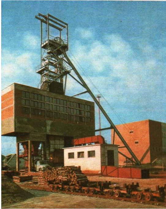
Rákhegy II. szállítóakna

Az OMBKE kincsesbányai szervezetének 1960 óta volt aktív tagja. 1973-tól 1989-ig a helyi szervezet elnöke. Jelentős szerepet vállalt szakmai összetartozás és hagyományápolás erősítésében. Kezdeményezője volt a gánti Bauxitbányászati Múzeum létrehozásának, ahol a Fejér megyei bauxitbányászat létrejötte, fejlődésének, jellemző eszközeinek bemutatásával állítanak emléket a jelenkornak.