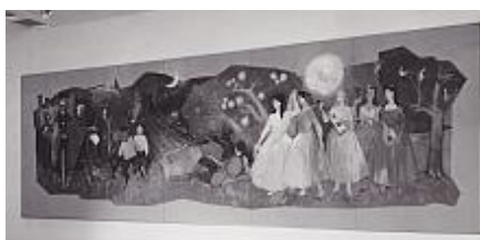
Csongor és Tünde, pannó Aron Nagy Lajos