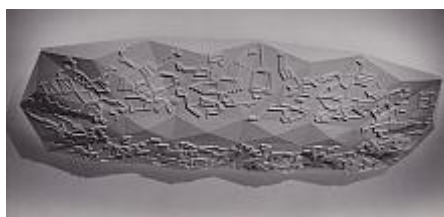
Szoborcsoport Vigh Tamás