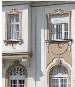
Csorna, új községháza 1927.