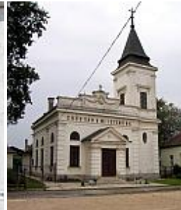
Csorna, Evangélikus templom 1930.