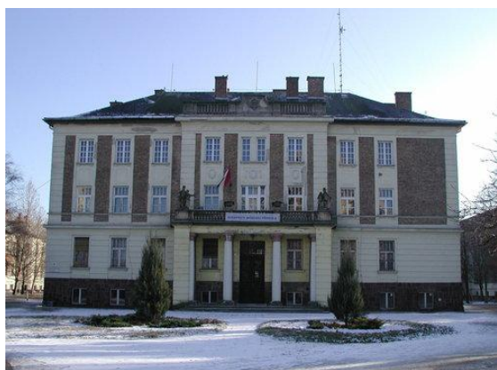
Óbudai Egyetem Alba Regia Egyetemi Központ

munkájában, mind emberi tartásában kiváló embernek ismerték, akinek a korai elvesztése mindnyájuk számára megrázó volt.