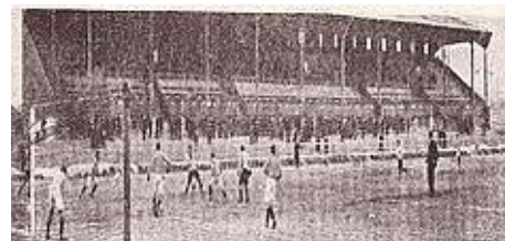
Az első fényképek az FTC pályáról

Több sportépületet tervezett Hajós Alfréd építésszel (1878-1955), aki mellesleg az első újkori olimpia kétszeres úszóbajnoka, többszörös Európa-bajnok és az 1924-es párizsi szellemi olimpia építészeti kategóriájának győztese is volt. Nevükhöz fűződik a Millenáris Sporttelep újjáépítése, betonteknőjének tervezése, amellyel akkor nemzetközi elismerést vívtak ki. A létesítmény eredeti formájában Bláthy Ottó villamosmérnök tervei szerint épült 1896-ban. Az 1928-as átalakítás során a kerékpáros világbajnokságra való felkészüléshez a pálya hossza 415 méter lett és a kanyarokban 36 fokban döntött.