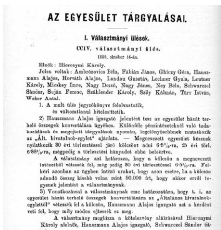
Részlet az Egylet jegyzőkönyvéből

Szakirodalmi munkássága elsősorban az árvízmentesítés, tagosítás és a vízjogi kérdések témakörét érintette. Munkája elismeréseként a Ferenc József-rend lovagkeresztjével tüntették ki.