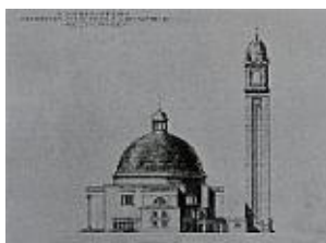
Fábián Gáspár nyertes pályázati terve 1929. (Molnár Tibor rajzaival)