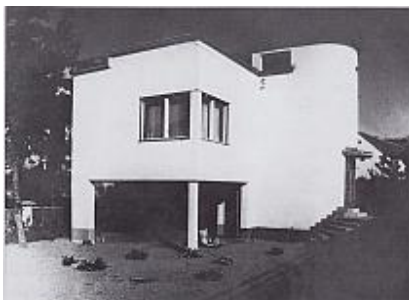
Várkörút 11. Molnár Tibor háza 1933.

Építészetének egyik legszebb megnyilvánulása az 1933-ban felépült saját lakóháza, aszimmetrikus szerkesztésű, lapostetős modern villa a Várkörút 11. alatt. Geometrikus tömegformák összekapcsolásából született, karakteres előtetős bejárattal, imponáló arányú nyílásrendszerrel, a ház baloldalán eredetileg nyitott terasszal. A szomszéd telekre megtervezte építészeti folytatását, az egészségházat.