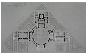
Prohászka Ottokár Emléktemplom

Páratlan kordokumentumot alkotott, amikor kedves természetességgel, anekdotákkal színesítve, szemléletesen ecseteli gyermekkorát Fehérvárat. Nagy tisztelettel emlékezik meg gimnáziumi tanáraitól. Egyetem után 10 évig Budapesten Fábián Gáspárnál dolgozott. „Helyi tervezései közül a leánygimnázium, az Irgalmas Nővérek iskola és rendház bővítése, a Prohászka emléktemplom munkáin dolgoztam az 1929-33 években.(...) Rajzaim alapján egy szobrász megformálta a templom gipsz modelljét.” Önállósággal elvégzett tetszetős terveivel komoly része volt az emléktemplom tervpályázatán elnyert I. díjban, a kiviteli terveket is ő készítette.