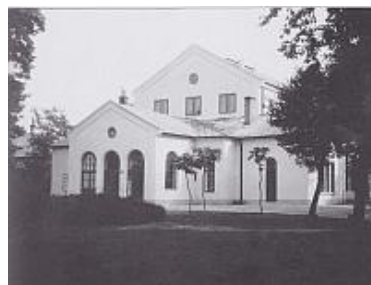
Lövölde csarnok 1937.

1937-ben adták át a Molnár Tibor tervezte tornacsarnokot a vasútállomás melletti Lövöldében. Akkor ez a létesítmény az ország egyetlen fedett sportcsarnoka volt. „ Ide kívánczok a két elsőrendű sportpálya és a Lövölde-kerti sportcsarnok, amely akkor az első volt a vidéki városok között. Sajnos az épület tönkrement, a légítámadásoktól használhatatlanná vált, le kellett bontani maradványait.”