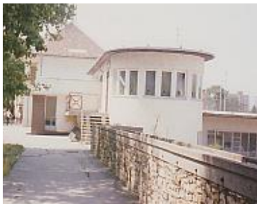
Korcsolyapálya melegedője 1937.