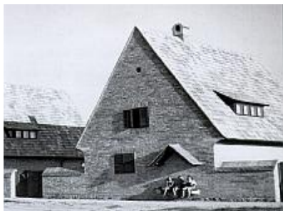
Batthyány utcai ONCSA-házak 1938.

„Érdemes megemlíteni az ONCSA akció lakóház építéseit a sokgyerekes szegény családok számára. Az első kísérlet a Batthyány utca melletti téren egy sor szabadon álló emeletes-kertes volt, Thomasz A. vázlatára alapján a Mérnöki Hivatal terve szerint.” A 4 lakásegységből álló magastetős házsorban galériás megoldást terveztek sokgyermekes családok számára.