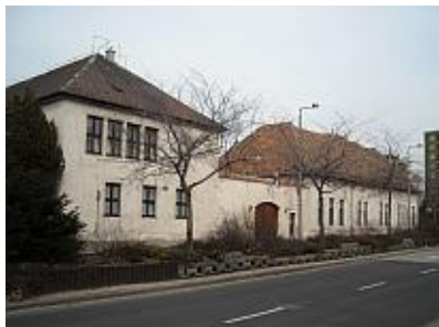
Aggintézet bővítése 1941.

A korcsolyapálya melegedőjét is modern épülettel váltották fel. „Az egészséget szolgáló létesítményünknek tartom a jégpálya, tenispálya új épületét, amelyet szintén a Mérnöki Hivatal tervezett meg.” A homokosri új vásártér „cédulaháza” a stílusjegyei alapján azonosítható be Molnár Tibor tervezései közé.