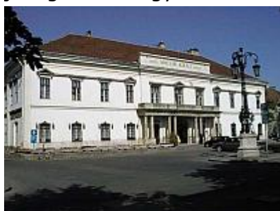
Székesfehérvár, Magyar Király Szálló v. Schmidegg-palota 1810.

A budai Sándor-palota szinte pontos mása megtalálható Székesfehérváron, a közel ugyanakkor, 1806-1810 között épült Schmidegg-palota, mely később Magyar Király Szálló néven vált ismertté, mind a mai napig. Az építőmester nevét a fellelt iratok nem említik, de e korai időszakban a homlokzat tiszta, kiérlelt klasszicista jellege miatt egy messzebről jött alkotó közreműködése valószínűsíthető.