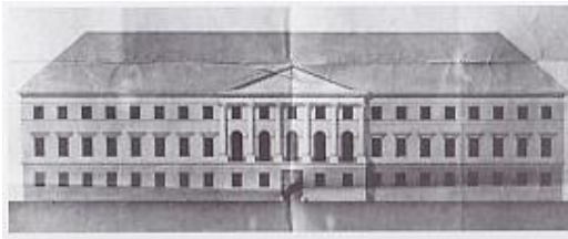
Székesfehérvár, megyeháza 1807 – 1812, homlokzati terv