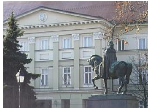
Székesfehérvár, megyeháza

1810 körül épült Fehérváron a Fő utca és Országzászló tér sarkán az egyemeletes klasszicista sarokház (Galla-ház), nagy valószínűséggel Pollack Mihály terve szerint.