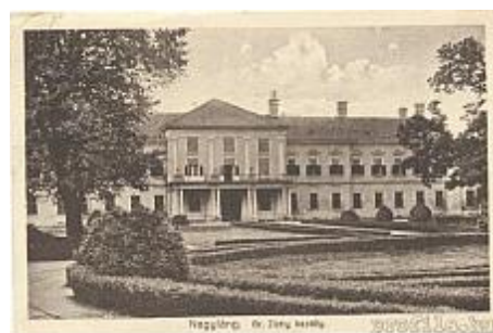
Nagyláng (Soponya) Zichy-kastély 1807.

Pollack pontosan ebben az időben dolgozott először Fejér megyében. Korai országos ismertsége az arisztokrata körökben a magyarázata annak, hogy alighogy Bécsből Pestre költözött, megbízást kapott a Zichy család nagylángi (ma Soponya) kastélyánál a főhomlokzat reprezentatív, teljes átépítésére.