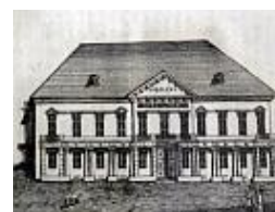
Budai várnegyed, Sándor palota 1806.