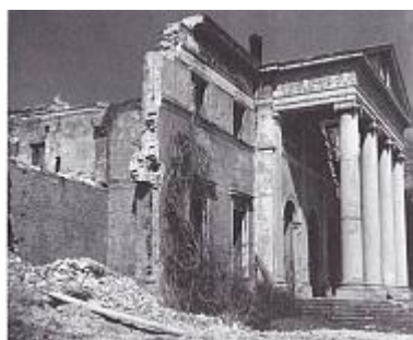
Alcsút, József nádor kastélya 1945 után...