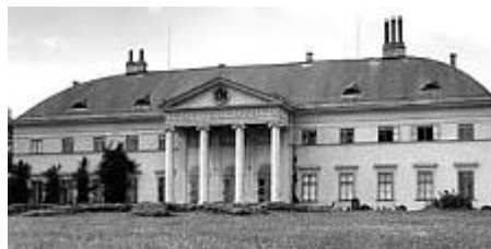
Alcsút, József nádor kastélya, 1819 -1829