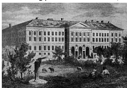
Ludoviceum (Katonai Akadémia) 1829 – 1836

A régi Pesti Vigadó épületét 1826-1832 között építette, gazdag életműve legszebb alkotásai közé tartozott. Sajnos az 1848-49-es forradalom és szabadságharc idején Pest bombázásakor találat érte, s újat kellett helyette építeni, ami viszont már Feszli Frigyes alkotása lett, Pollack halála után, 1859-65-ben.