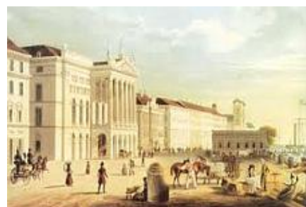
régi Pesti Vigadó 1826 – 1832

A budai Sándor-palota szinte pontos mása megtalálható Székesfehérváron, a közel ugyanakkor, 1806-1810 között épült Schmidegg-palota, mely később Magyar Király Szálló néven vált ismertté, mind a mai napig. Az építőmester nevét a fellelt iratok nem említik, de e korai időszakban a homlokzat tiszta, kiérlelt klasszicista jellege miatt egy messzebről jött alkotó közreműködése valószínűsíthető.