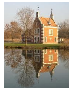
Kastélypark, hollandi ház

Kastélyai közül mégis a legjelentősebb az Alcsúton 1819-1829 között épült, József nádor számára tervezett kastély volt. A geometrikus egyszerűségű, zárt épülettömeg, a tagozatok harmóniája, a gondosan megmunkált részletek, és kiváló elhelyezése a tájban, az épületet a hazai klasszicizmus legtöbb kastélya fölé helyezték. A kastély a II. világháborúban terv-, és iratanyagával együtt elpusztult. A széthordás után a műemlék-védelem a kastélyból is csak a főépület árván merevedő homlokzati falát tudta megtartani.