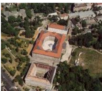
Ludovika légifelvétel 2000 után