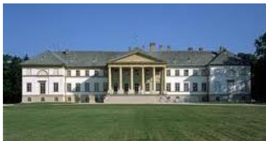
Dég, Festetich kastély 1810-1815