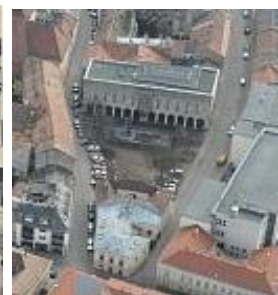
mai Bartók Béla tér

A 30-as évek elején tervezte meg a Korcsolyázó Egylet házát (későbbi Sporthivatalt) az Ady Endre utcában. 1937-ben a Bástya utcai Schmidl-ház hátsó udvarában építette fel saját házát, főhomlokzatának sarkán Ohmann Béla Szent József kőszobrával. A három évig, aprólékos gondossággal tervezett magastetős modern lakóház az akkoriban kialakuló Várkörúti villasor egyéni ízű elemévé vált.