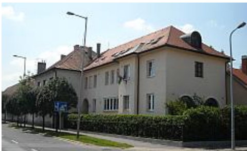
Aggintézet bővítése, Nővérszállás

Csitáry Emil polgármester az 1930-as években nagyszabású városfejlesztési koncepciót dolgozott ki, a rendezési folyamat szakmai megvalósításának élén Kotsis Iván és Schmidl Ferenc építészek álltak, hozzá Hóman Bálint székesfehérvári nemzetgyűlési képviselő, miniszter révén állami fejlesztési pénzeket kaptak. A belváros rendezésénél a bontás, építés, átalakítás eszközeivel egyaránt éltek. Bontásokkal új tereket alakítottak ki. Az Országzászló tér területének rendezési tervét Schmidl Ferenc készítette, és az Ince pápa tér (ma Bartók Béla tér) is így módon jött létre.