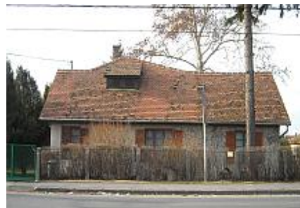
Fiskális úti nyaraló

1940-ben összeállította Székesfehérvár városfejlesztési tervét, amely a korszerű városrendezési elvek és a realitás iránti érzék jegyében készült. A megépült középületeken kívül a székesfehérvári Szőlőhegyre és a Balaton partjára nyaralókat tervezett.