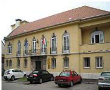
Korcsolyázó Egylet háza

Molnár közös tervezésének. Schmidl a romantikus hajlamai szerinti boglyas-íves földszintet, a meg nem valósult impozáns középlépcsőkart, én a képtár feladatnak megfelelő, csupa ablak, üvegtető első és második emeletet, közöttük pedig rava-szul megszerkesztett kis lépcsőházat terveztem. Ebből kicsit furcsa eredmény lett? A mai képet csúfító tűzfalak már a háború következménye: az egyemeletes lakóház elpusztulásának eredménye."