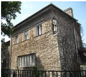
Schmidl Ferenc saját háza a Várkörúton 1937.