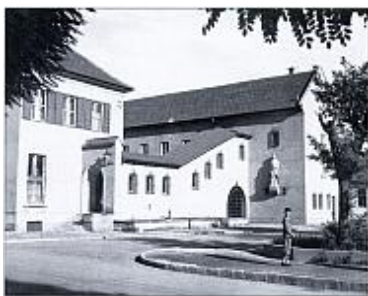
Vitézi Székház 1940-43.