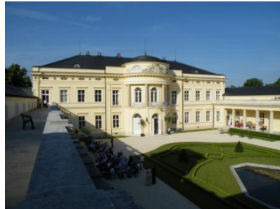
Fehérvárcsurgó Károlyi kastély