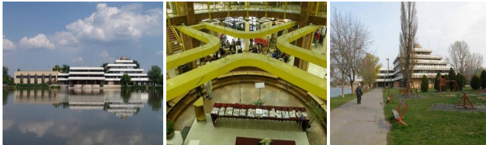
Szabadművelődés Háza, Tóparti Gimnázium és Művészeti Szakközépiskola Az épületegyüttest a város 2010. évben Építőipari Nívódíjban részesítette

a hozzá kapcsolódó 440 fős Nemes Nagy Ágnes Kollégiumot, sportcsarnokot, egyéb kiszolgáló épületeket, mely munkákba társtervezőként bevonta fiatal kollégáját, Szigeti Gyulát. Schulz István tervei alapján épült fel 1972-ben a város talán legszebb épülete az egykori Úttörő- és Ifjúsági Ház, ma Szabadművelődés Háza, Tóparti Gimnázium és Művészeti Szakközépiskola. Az ötszintes épület tetjén helyezték el a város félgömbalakú csillagvizsgálóját. Az épülethez 1989-ben bővítményként építettek Kelemen Gábor tervei szerint, mely az eredeti épülettel szerves egységet képezve művészeti középiskolaként működik.