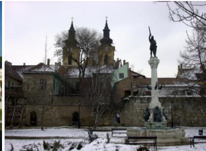
Szfv. Kettős várfal

Tudományos és közéleti életben több társadalmi-szakmai funkciót is ellátott, kiemelkedik ezek közül a Fejér Megyei Építészek Kamarájának vezetőségi tagsága, Szfvár. Önkormányzati képviselők építészeti tanácsadója, ICOMOS-tagsága.