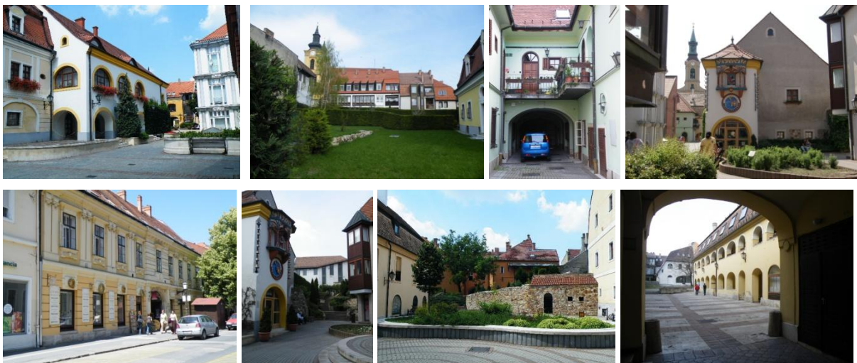
Székesfehérvár Kossuth utcai tömbfeltárás, képei