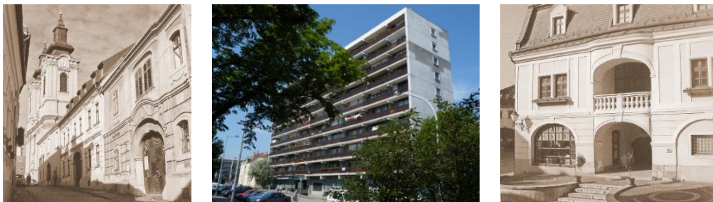
Budenz – ház

Korai munkái közül fontosnak tekintette a csákvári, volt Eszterházy-major („Gurdi-major”) területén lévő védett épület felújítását, a védett környezethez illő új gazdasági épület tervezését. A hatvanas években középületeket, lakóházakat tervezett. Ezek közül kiemelendő a Hantosi-, Kőszárhegyi kultúrház, a Székesfehérvár Megye ház utcai foghíjbeépítések. A műemlékek iránti vonzalma már a 60-as évek közepén megnyilvánult. E munkáknak kiemelkedő példája a Szfv. Arany J. utca 12. sz. alatti műemléki védelem alatt lévő „Budenz – ház” kutatási, tervezési munkája, mely helyet ad a város Ybl – gyűjteményének. 1972-ben készült el a Székesfehérvár, Esze T. utcai középmagas, 100 lakásos OTP ház.