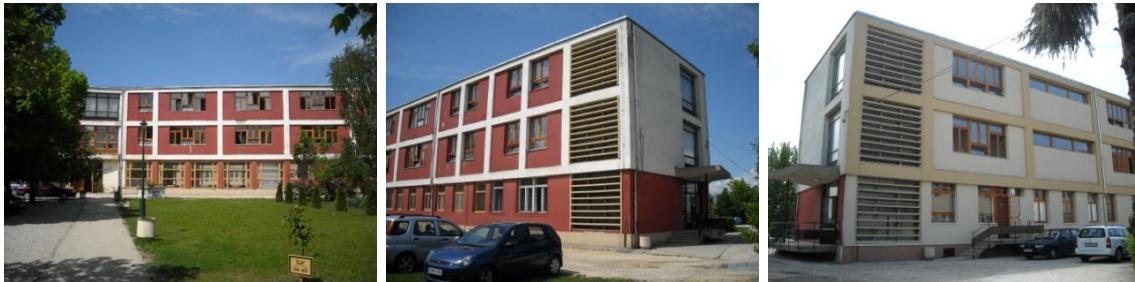
Székesfehérvár Vörösmarty Mihály Szakképző Iskola és Kollégium

A Fejér Megyei Tervező Iroda meghatározó személyisége volt 1990-ig. Szakmáját és városát megszállottan szerető építész, ki gazdag, színes életutat járt végig, és örök érvényű jeleket hagyott maga után. Vezető tervezőként sok fiatal építészt nevelt, kik közül néhányan országos szinten is meghatározói lettek az építész szakmának. Híres szabadkézi rajztudását, grafikai készségét számtalan nyertes országos pályázat, tervek sora őrzi. Tehetsége, a részletek iránti érzékenysége első nagyobb munkájában nyilvánult meg, mikor 25 évesen megtervezte a Székesfehérvári Balatoni úti Vörösmarty Mihály Szakképző Iskolát és kollégiumot, melynek építészeti értékei a mai ízlés szerint is változatlanul friss erővel hatnak.