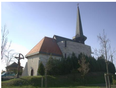
Szent Donát kápolna