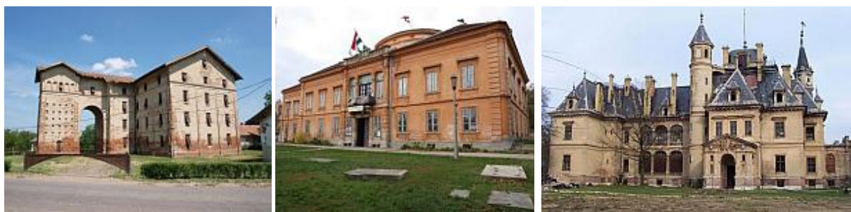
dobozai Wenckheim birtok magtára

Az 1980-as években számos kastély készült kezei alatt. (Csurgó, Doboz, Kétegyháza, Lengyeltóti, Mácsa, Marcali, Ókígyós, Surány stb.) Kiemelkedik ezek közül 1880-1882-ben a Parádsasváron épült Károlyi-kastély és 1983-ban a turai Schossberger-kastély.