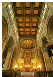
katolikus templom, Fót

Ybl Miklós tett egy látogatást Itáliában tél idején, s utána ismét munkához fogott, a fehérvárcsurgói kastélyon végzett tervezői munkát. Az 1844-ben barokk stílusban emelt, majd később Heinrich Koch bécsi építész és a művezetéssel kapcsolatos tervezésbe bekapcsolódó Ybl Miklós tervei alapján a rezidencia felújítása neoklasszicista stílusban valósult meg.