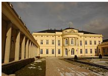
Fehérvárcsurgói Károlyi kastély

Ybl Miklós tett egy látogatást Itáliában tél idején, s utána ismét munkához fogott, a fehérvárcsurgói kastélyon végzett tervezői munkát. Az 1844-ben barokk stílusban emelt, majd később Heinrich Koch bécsi építész és a művezetéssel kapcsolatos tervezésbe bekapcsolódó Ybl Miklós tervei alapján a rezidencia felújítása neoklasszicista stílusban valósult meg.