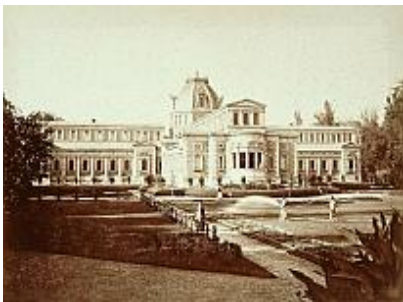
Margit-szigeti Margit-fürdő (elpusztult)

Míg korai stílusát a romantika jellemezte, keleti elemekkel tűzdelt román részletekkel, később az olasz reneszánsz stílus újjáteremtésének gondolata foglalkoztatta és neoreneszánsz stílusban tervezte épületeit. Rendkívül termékeny korszaka következett, bérházak, paloták, villák, kastélyok, templomok épültek tervei nyomán, a legtöbbjének kivitelezését is vezette. (Pest Nemzeti Lovarda, Festetics-palota, Pálffy-palota, Első Pesti Hazai Takarékpénztár -későbbi Ybl-palota, Gerla Wenckheim-kastély, margitszigeti főúri Margitfürdő, Albertirsa Szapáry-sírkápolna, Kecskemét Evangélikus templom, Bakáts téri katolikus templom, stb.)