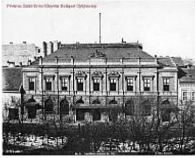
Képviselőház, Bródy Sándor utca