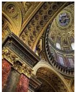
Budapesti Lipótvárosi templom – Szent István Bazilika

Ezekkel szinte egy időben a budai Vár kiépítésén is fáradozott, ebben unokaöccse,