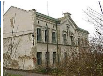
Sárbogárd, Nagyhörsök kastély

Ybl Miklós volt az építész a 15. századi eredetű lovasberényi Cziráky-kastély újabb bővítéseinek, az udvari szárnyak és sarokpavilonok 1850 körül épültek. A nagyhörsöki kastély terveit 1852-ben készítette el Zichy (Paulai) Ferenc megbízásából, az építkezés 1855-re fejeződött be. Az épületet az egykori tulajdonos feleségéről, Kornis Annáról Anna-várnak is nevezik. Ybl korai, angol gótikus stílusú alkotásai közé tartozik a kastély. (1870-71-ben Gottfried Semper német építész terveket készített a kastély francia neoreneszánsz stílusú átalakítására, de az átépítésre nem került sor.) Az egykor emeletes, mozgalmas, kötetlen alaprajzú épület nagy részét mára lebontották.