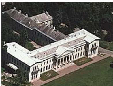
Fóti Károlyi kastély

1845-ben megbízást kapott Károlyi Istvántól, hogy építse át fóti kastélyát, valamint tervezze meg a katolikus templomot, ez első önálló munkája kiérlelt romantikus stílusban készült.