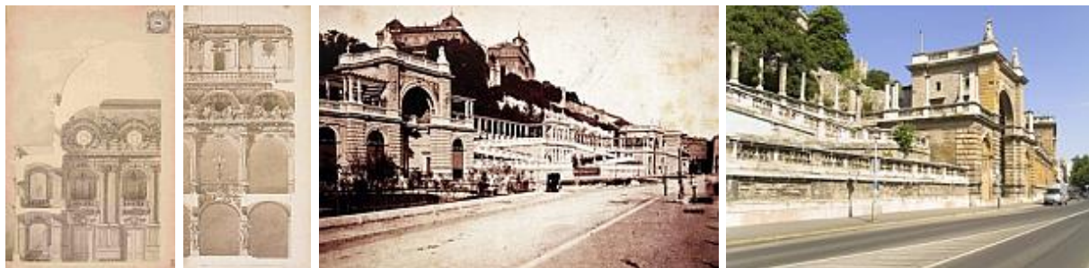
Királyi Palota tróntermének részletei, Y.M.

1875-1882 között a budai vár Dunára néző lankáján a Várkert-bazár megvalósításán is dolgozott mely olasz, német és francia függőkeretek mintájára készült. Belépett a Közmunkatanácsba, 1882-ben megkapta a Lipót-rend lovagkeresztjét, 1885. június 21-én pedig a király a főrendiház tagjává nevezte ki.